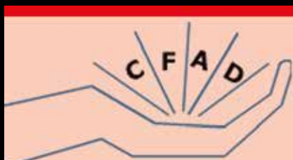
Imagem 4 – Edição de CD com jogos e vídeos para a sensibilização ambiental (produzido no âmbito do Projecto Microgeração IPSS | CFAD | 2016).

Centro de Formação Assistência e Desenvolvimento